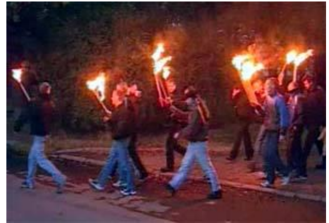
Скинхеды. Факельное шествие в Петербурге.