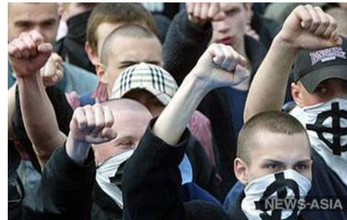
В Костроме скинхеды напали на неформалов